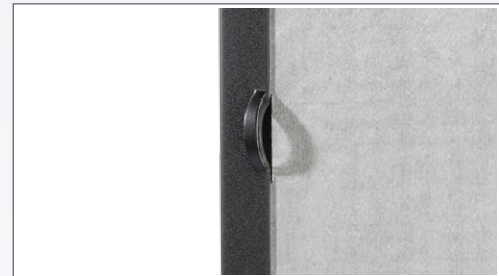
Gehäusesicherheitsverschluss über Laschenlösung