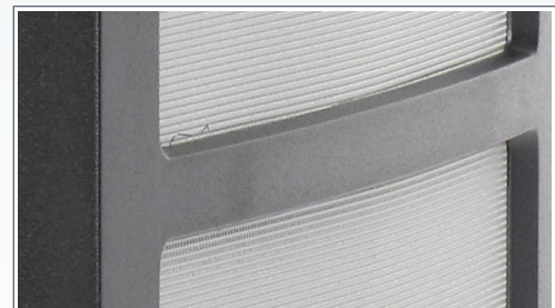
Lochbleche in der Frontblende