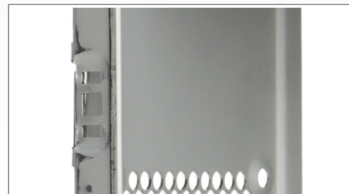
Aufnahme für Intrusion Switch