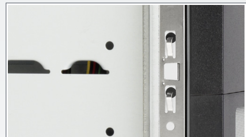
Eingearbeitete Stahlfedern an den Gehäusekanten für beste EMV-Sicherheit